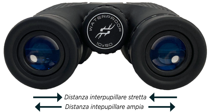
→ Distanza interpupillare stretta ← ← Distanza interpupillare ampia →