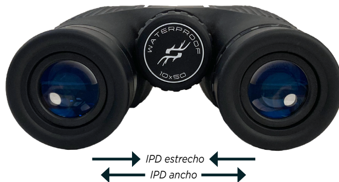
Fig. 3 Ajuste de distancia interpupilar