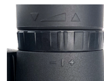
Fig. 4 Anillo de ajuste dioptría