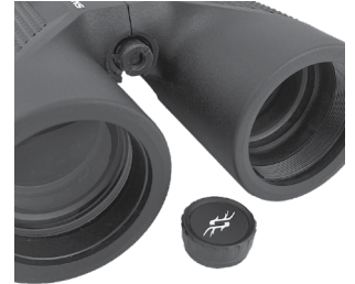
Fig. 7 Tripod Socket

To attach the binocular to a tripod or monopod, unscrew or pull off the cap, which covers the threaded socket at the far end of the center hinge (Fig. 7), and set it aside safely. Use a compatible binocular tripod adapter accessory (90° angle bracket), such as the Bushnell #161002CM, to attach your full size Pro Hunter binocular to any standard tripod in a horizontal position to provide a stable image during prolonged viewing.