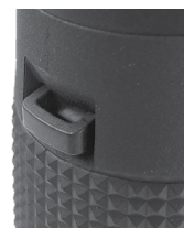
Fig. 5 Attache de bandoulière

Pour fixer la bandoulière, faites passer les extrémités de celle-ci dans les attaches prévues à cet effet (Fig. 5) de chaque côté des jumelles (commencez par le bas des attaches puis poussez la bandoulière vers le haut comme indiqué), puis de nouveau dans la boucle en plastique (Fig. 6). Ajustez la position des jumelles à votre goût sur votre poitrine tandis qu'elles pendent autour de votre cou, en changeant la longueur de la partie de la bandoulière qui passe dans les attaches et dans la boucle d'une longueur égale de chaque côté. Si vous préférez utiliser une bandoulière dotée d'anneaux métalliques, fixez-les à la fermeture en plastique située sur les attaches de la bandoulière et non directement sur l'attache, pour éviter que les anneaux n'endommagent la finition des jumelles.