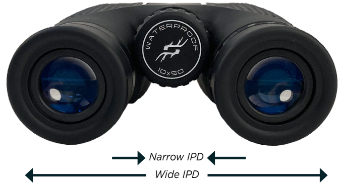
Fig. 3 Interpupillary Distance Adjustment