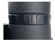
Abb. 4 Dioptrienanpassungsring