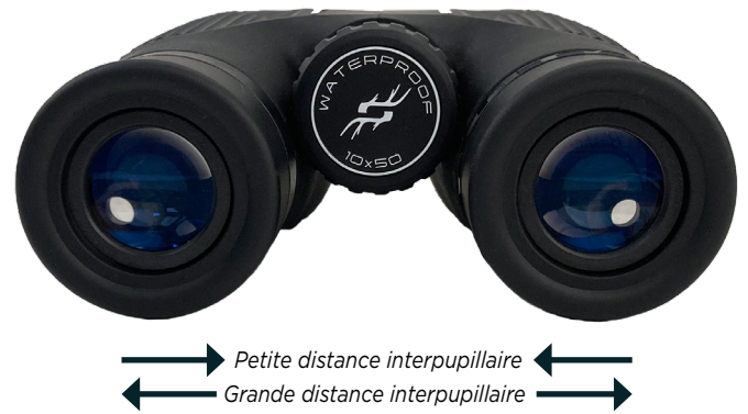
Fig. 3 Réglage de la distance interpupillaire