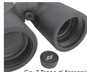
Fig. 7 Tappo di fissaggio del treppiede

Per montare il binocolo su un treppiede o un monopiede, allentare o rimuovere il tappo che copre la presa filettata all'estremità della cerniera centrale (Fig. 7) e riporlo in un luogo sicuro. Utilizzare un adattatore per treppiede compatibile (staffa a 90 gradi), come ad esempio il modello n. 161002CM di Bushnell, per fissare il binocolo Pro Hunter in scala reale a qualsiasi treppiede standard in posizione orizzontale in modo da garantire che, durante l'osservazione prolungata, l'immagine sia stabile.