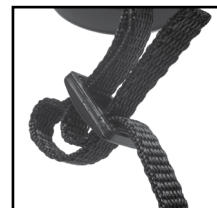
Fig. 6 Correa y Hebilla