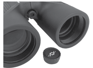
Fig. 7 Manchon de fixation du trépied

Pour fixer les jumelles sur un trépied ou monopode, dévissez ou retirez le capuchon qui couvre le manchon à vis à l'extrémité de la charnière centrale (Fig. 7) et déposez-le en lieu sûr. Utilisez un adaptateur de trépied pour jumelles compatible (support à angle à 90°), tel que le modèle Bushnell n° 161002CM, pour fixer vos jumelles Pro Hunter taille intégrale en position horizontale sur un trépied standard afin d'obtenir une image stable lors de l'observation prolongée.