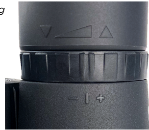
Fig. 4 Diopter Adjustment Ring