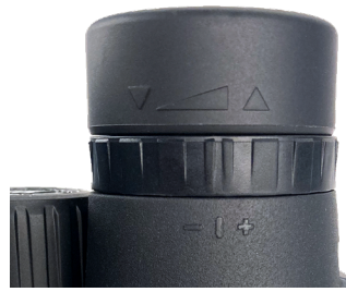
Abb. 2 Augenmuschel in der „unten“-Position (für die Verwendung mit Brille)