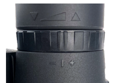
Fig. 4 Anillo de ajuste dioptria