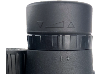
Fig. 2 Eyecup in "Down" Position (for use with eyeglasses)