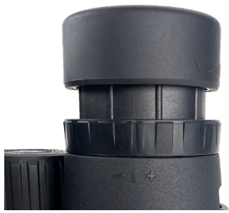
Abb. 1 Augenmuschel in der „oben“-Position (für die Verwendung ohne Brille)