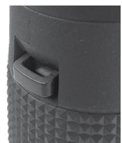
Fig. 5 Lengüeta de correa

Para poner la correa del cuello, pase los extremos de la correa por el asa de la correa (fig. 5) en cada lado de los prismáticos (empiece al fondo del canal y empuje la correa hasta arriba como se muestra), luego retroceda a través de la hebilla de plástico que hay en la correa (fig. 6). Ajuste la posición de los prismáticos en su pecho mientras cuelgan de su cuello como prefiera, cambiando la longitud de la sección de correa que atraviesa el canal y la hebilla de la correa la misma cantidad en cada lado. Si prefiere usar una correa de posventa con anillos metálicos, engánchelos en una cremallera de plástico que hay en las lengüetas en vez de instalarlas directamente en ella, para evitar dañar el acabado de los prismáticos por contacto con los anillos.