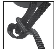
Fig. 6 Attache et boucle