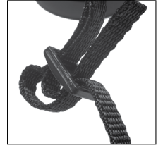
Fig. 6 Strap & Buckle