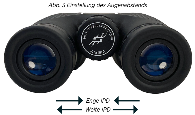
Abb. 3 Einstellung des Augenabstands