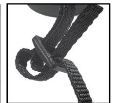
Fig. 6 Cinghia e fibbia