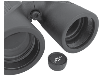
Fig. 7 Kappe der Stativfassung

Um das Fernglas auf einem Drei- oder Einbeinstativ zu befestigen, schrauben oder ziehen Sie die Kappe ab, die die Gewindemuffe auf der hinteren Seite des mittleren Scharniers abdeckt, (Abb. 7), und legen Sie sie an einem sicheren Platz ab. Verwenden Sie einen kompatiblen Fernglas-Stativ-Adapter (90° Befestigungswinkel), wie etwa das Bushnell-Modell #161002CM, um Ihr Pro Hunter-Fernglas auf einem beliebigen Standardstativ in einer horizontalen Position zu befestigen und ein stabiles Bild bei längerer Betrachtung zu haben.