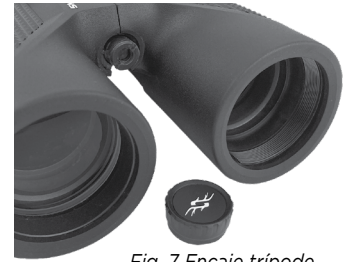
Fig. 7 Encaje trípode

Para colocar los prismáticos sobre un trípode o un monopié, desenrosque o quite el tapón que cubre la toma roscada en el extremo final del pivote central (fig. 7) y guárdelo en un lugar seguro. Use un accesorio adaptador compatible con el trípode de los prismáticos, (escuadra de fijación a 90°), como el Bushnell modelo núm. 161002CM, para colocar los prismáticos Pro Hunter de tamaño completo en cualquier trípode estándar en posición horizontal para conseguir una imagen estable durante un avistamiento prolongado.