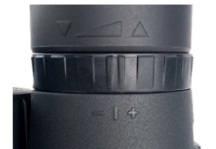
Fig. 4 Bague de réglage de la dioptrie